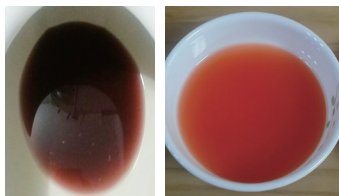
Des excréments sanglants (gauche) et des ématuries (droite)

Alors que je méditais sur les souffrances du Seigneur et de la Sainte Mère, combien cela avait été douloureux pour eux de subir de telles souffrances, j'ai alors subi ces souffrances à la place du Seigneur et de la Sainte Mère : j'ai senti que mon abdomen et mon corps étaient contorsionnés affreusement. C'est pourquoi je me suis dirigée vers la salle de bains à l'aide de volontaires. Du sang commençait à sortir de mon corps.