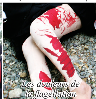
Les douleurs de la flagellation