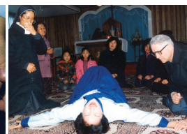
Les douleurs de la Crucifixion